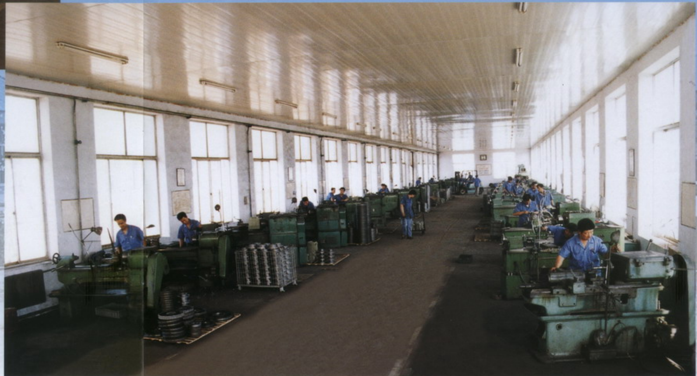
机械加工车间 machinery processing workshop