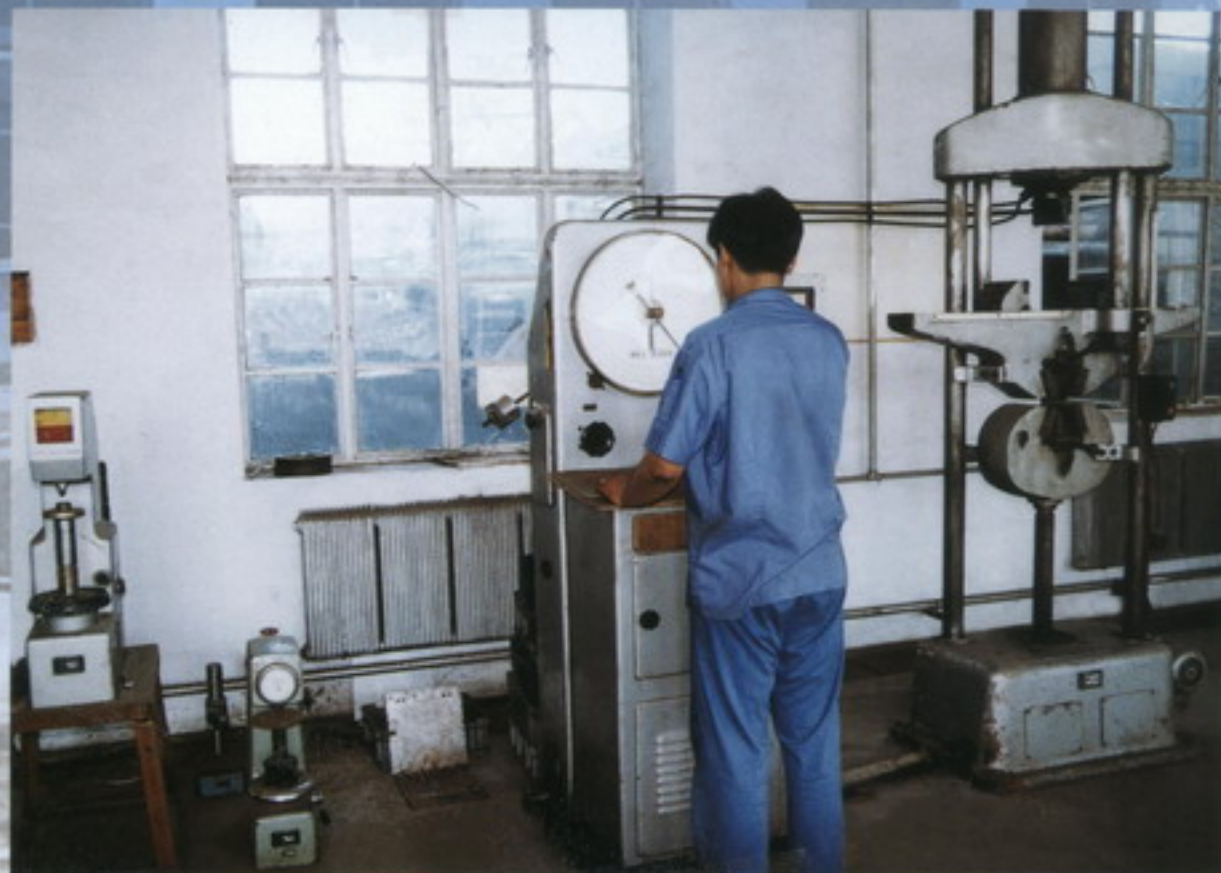
测试设备 testing equipment