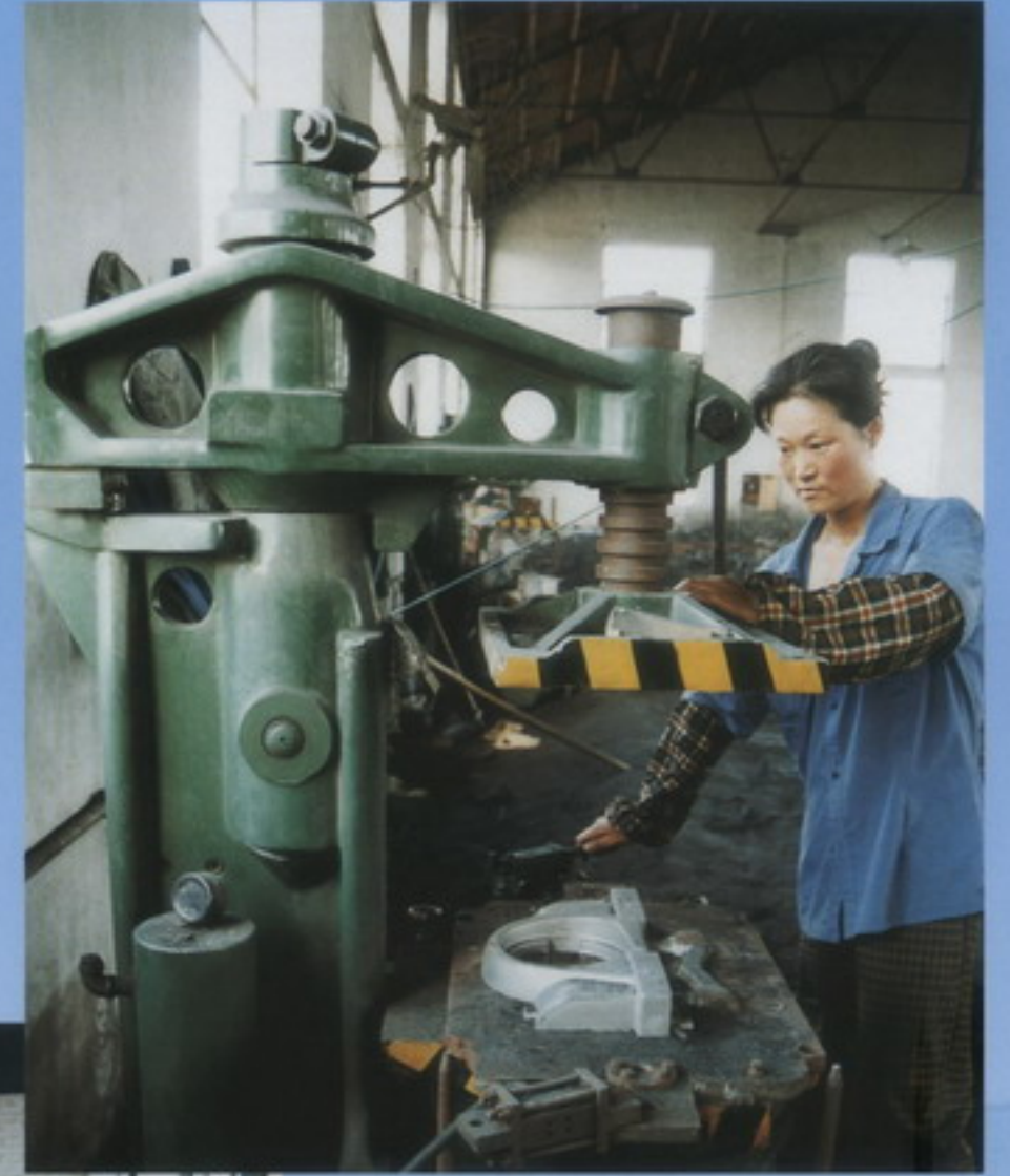
造型机 molding machine