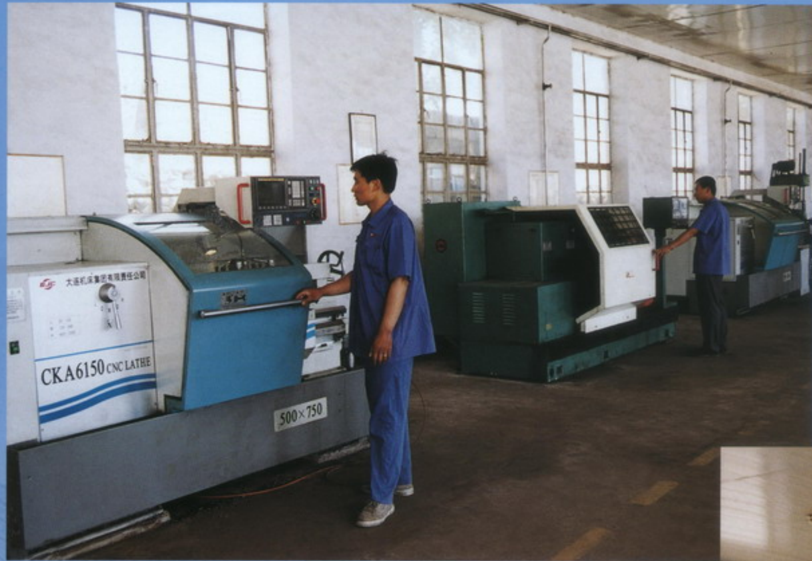
数控车床 numerical-controlled machine