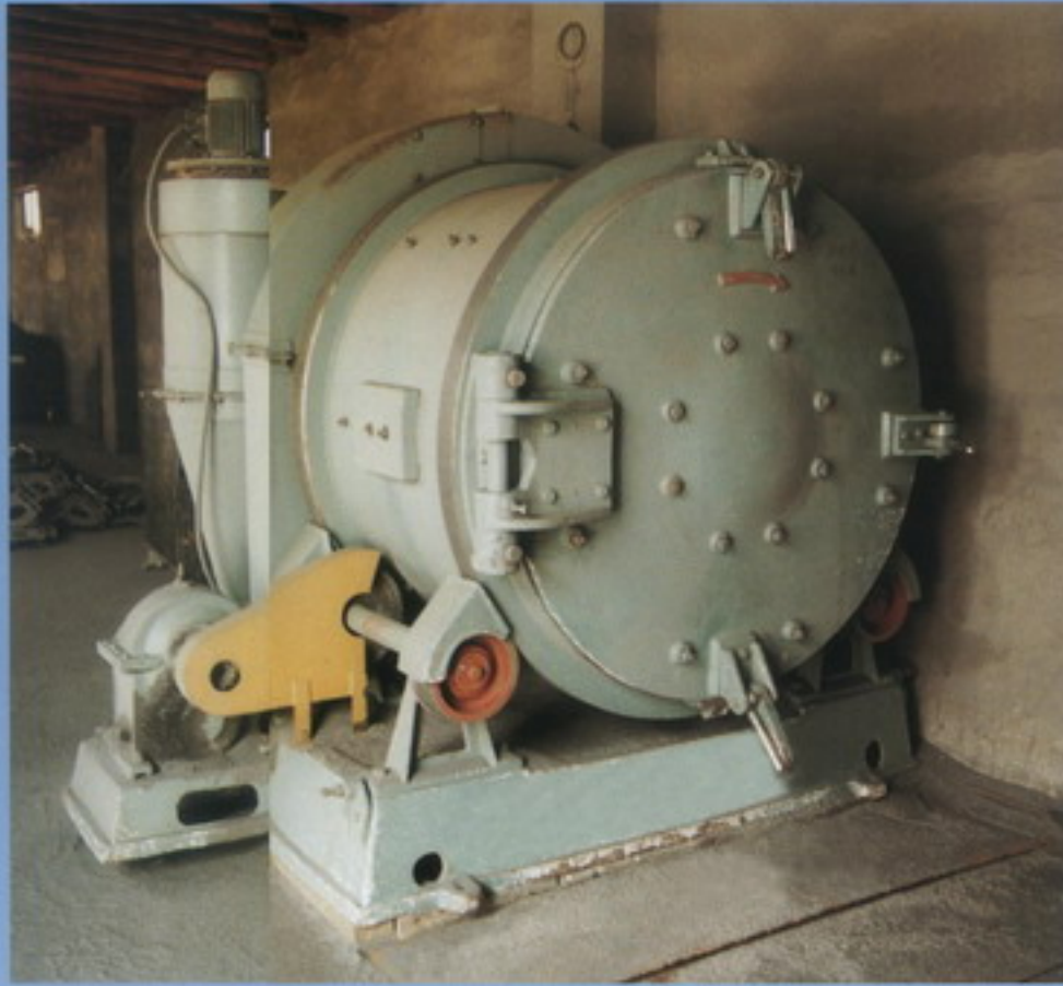
抛丸机 sandblasting machine