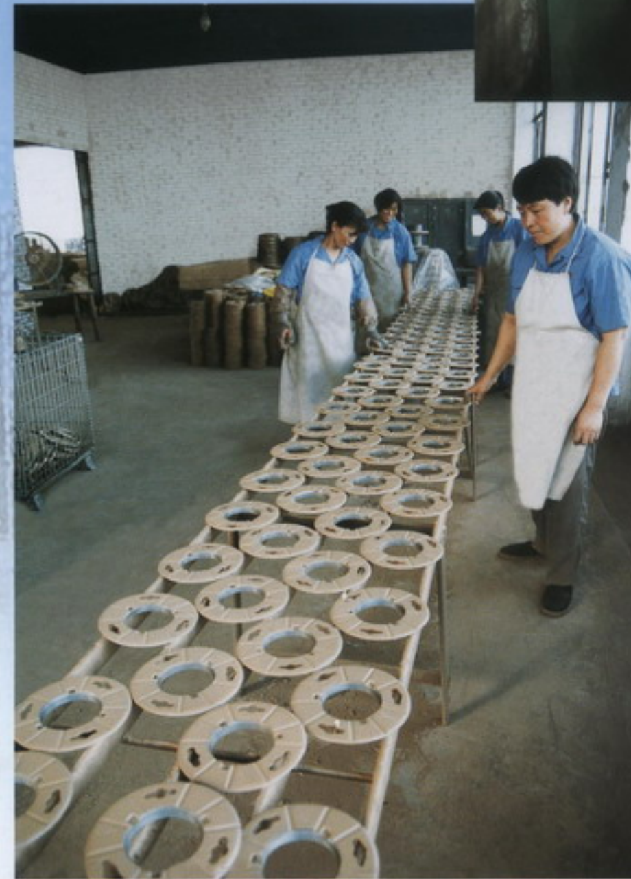
铸件生产线 casting production line