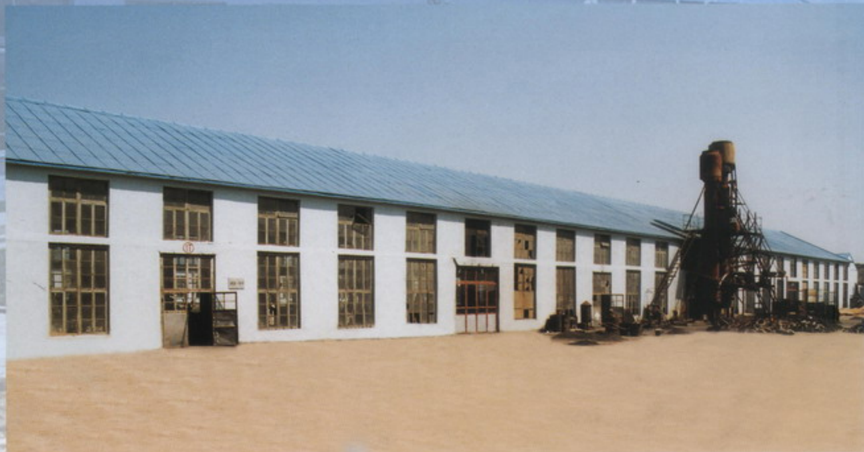
铸造车间 foundry workshop